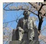
養育院初代院長 渋沢 栄一 の銅像